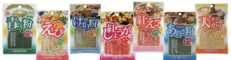
お好み焼き関連商品 すこやかシリーズ