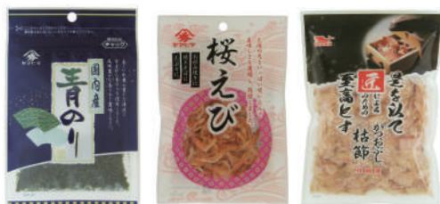
煮干しやふりかけ、こだわりの商品など取り揃えております。