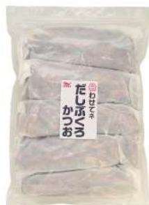
合わせね だしぶろかつお 1KG