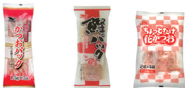
かつおパック製品